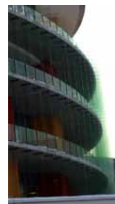
Fasaden täcks av tusentals tvärställda glasskivor på den nya Akuten

Värst av allt är det väl när man som orolig anhörig vill prata med någon om patienten. Större delen av personalen sitter upptagna vid sina datorer och får man tag i någon så blir man hänvisad till läkaren ”men hon kommer inte förrän i morgon till rondan”.