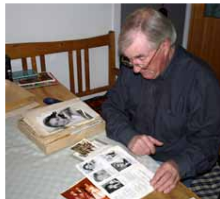
Bosse tar gärna fram gamla minnen i form av fotografier och programblad