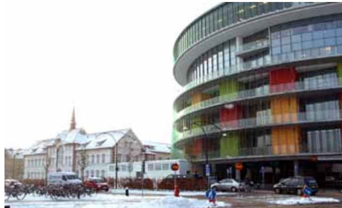
Gammalt och nytt på SUS. Den nästa 100 år gamla huvudbyggnaden t.v. och den ny Akuten t.h.

”Det är svårt att komma in på sjukhuset, men väl där får man den bästa vården” har man hört många människor säga. Men är det så? Som äldre upplever jag en dra-